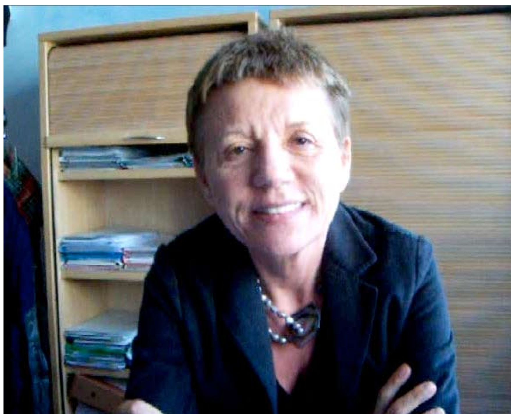
Video Angela Rosso

D) Prima ancora che vengano indette le assemblee per votare l'accordo per il fondo sanitario di gruppo e' già uscita la circolare con le nuove disposizioni a partire dal 1/1/2011. Cosa succederà se le votazioni avranno esito negativo? Verrà revocata la circolare e rimarrà in vigore la vecchia normativa fino a che non si raggiunga un nuovo accordo? Così si dà per scontato che i lavoratori accettino l'accordo.