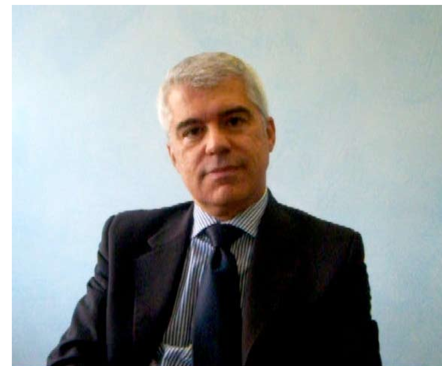
> Video Mauro Bossola

Nel momento in cui scriviamo la trattativa è interrotta perché il sindacato ha giudicato tali proposte inaccettabili, sia a livello politico (volontarietà) che tecnico. ■