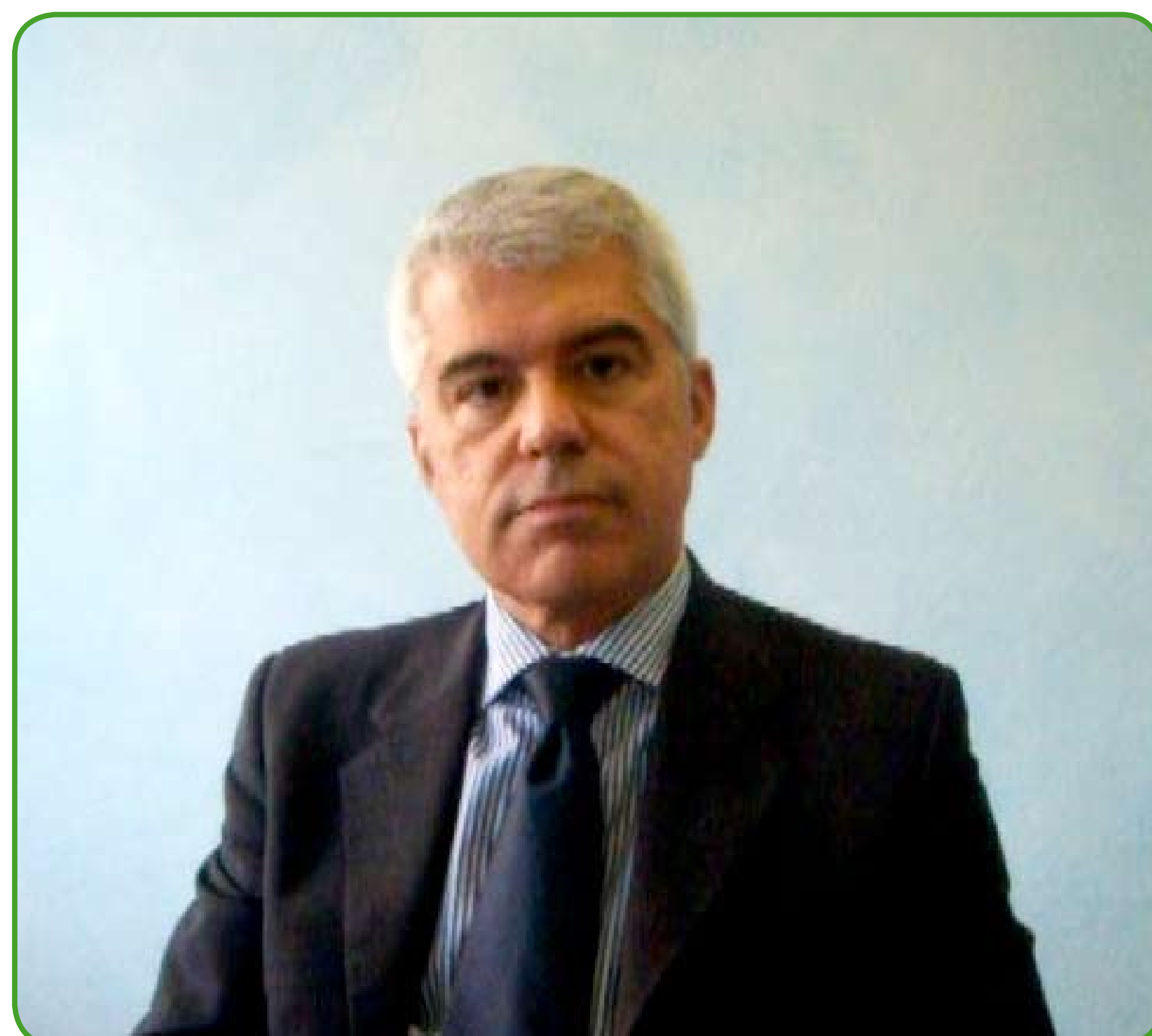
Video Mauro Bossola

Per quanto siano problemi differenti, sullo sfondo del confronto si staglia il rinnovo del contratto nazionale di lavoro; un impegno che riguarda chi in banca lavora e ci rimane ma anche chi ci verrà a lavorare.