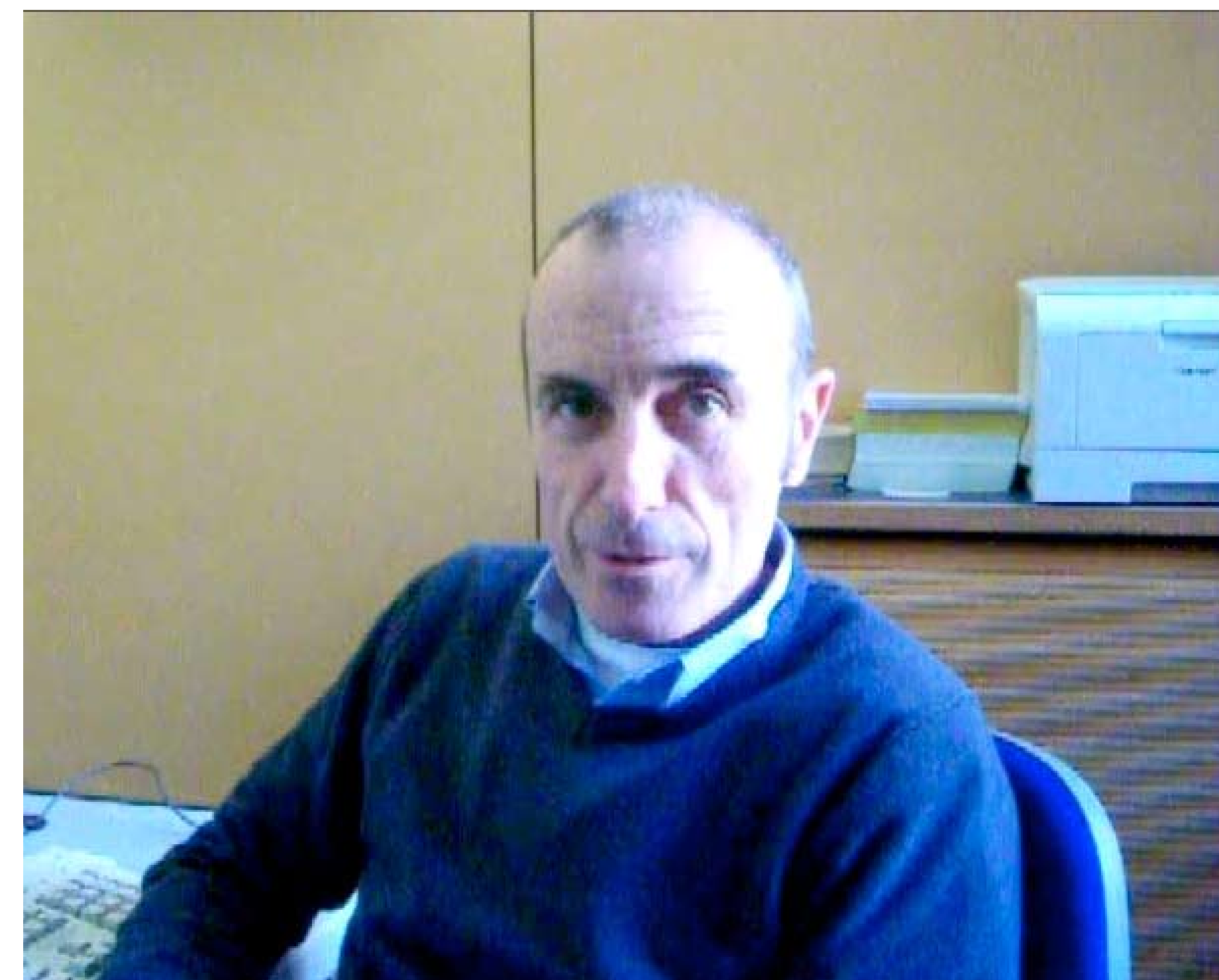
Video Roberto Aschiero