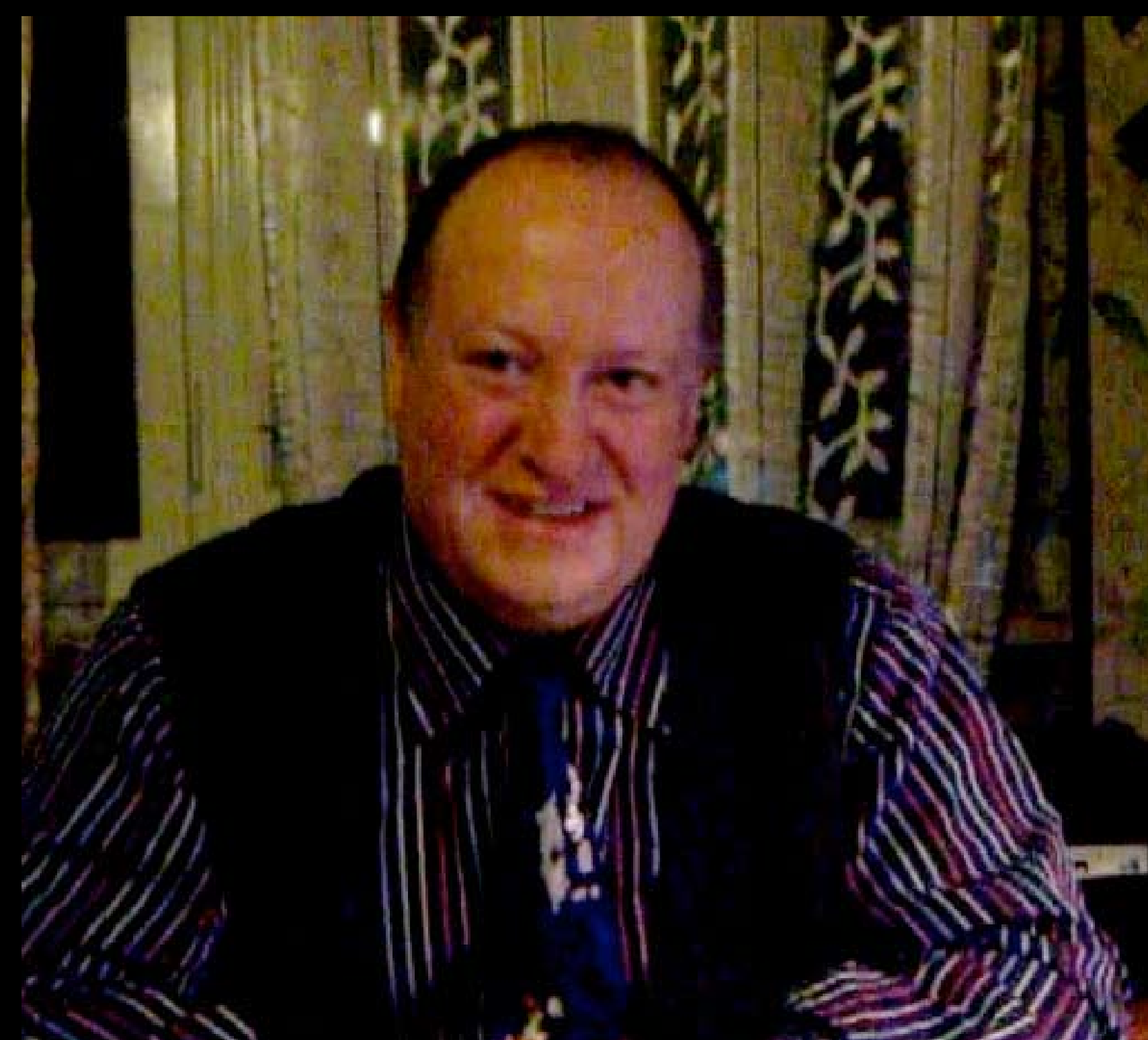
▶ Video Salvatore Taormina