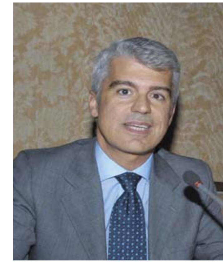
Segretario Generale Aggiunto Federazione Autonoma Bancari Italiani